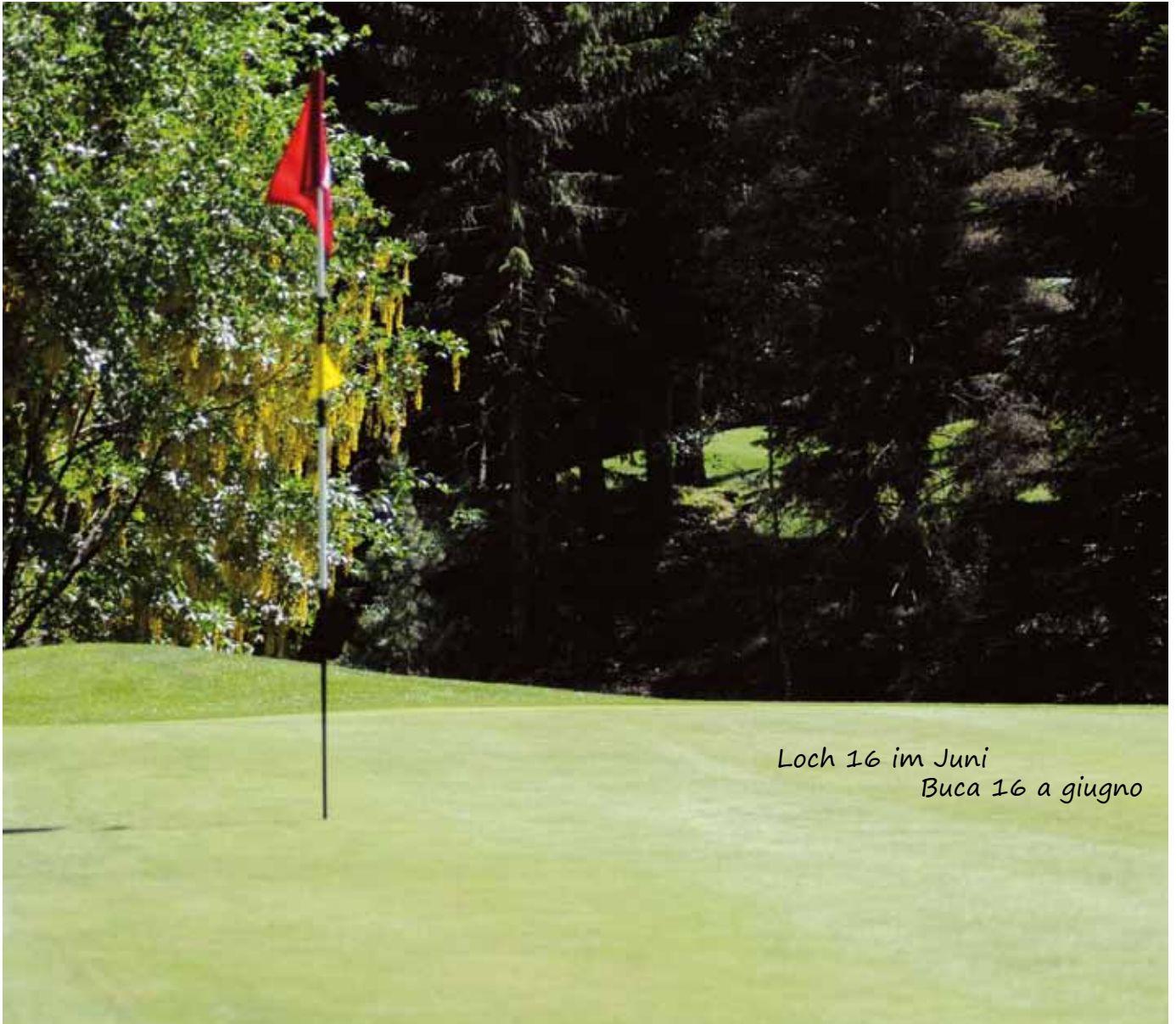
Loch 16 im Juni Buca 16 a giugno

So erreichen sie den Golf Club Petersberg