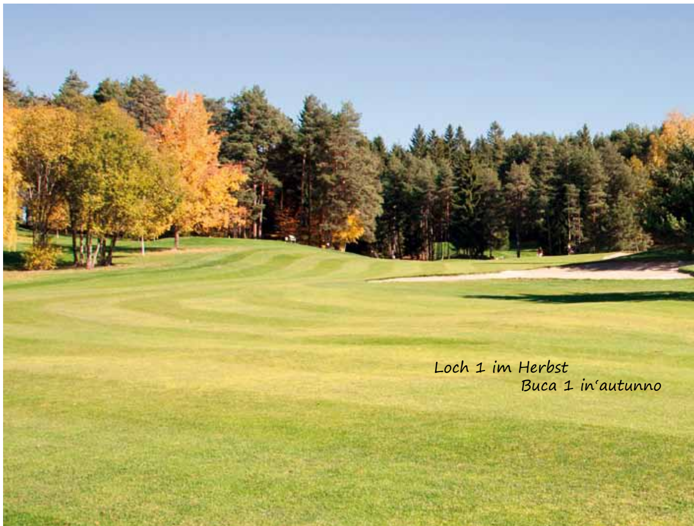
Loch 1 im Herbst Buca 1 in'autunno

Der Golf Club Petersberg wurde 1989 eröffnet und ist die älteste Anlage in Südtirol. Petersberg ist auch der einzige Platz in Südtirol der als Familienbetrieb geführt wird, vom Platz bis zur Verwaltung und zum Clubhaus wird alles von Familie Thaler direkt geführt. Für jedes Anliegen und jeden Wunsch wissen die Mitglieder und Gäste immer, an wen sie sich wenden können.